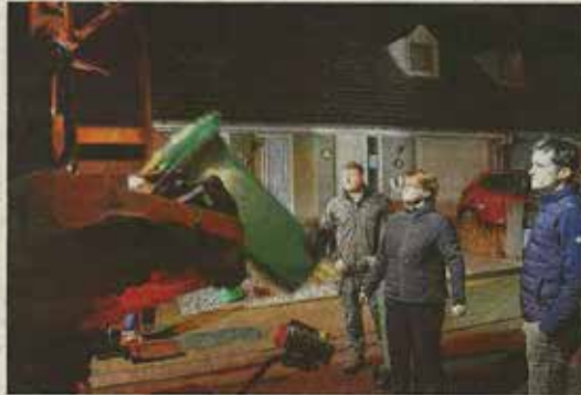
Ook in de Kanterstraat in Geluwe werden de eerste GFT-bakken opgehaald.

Bananenschillen, afgereden gras of koffiefilters werden in zowel Menen, Wevelgem als Wervik nog al te vaak bij het restafval gooid. Zonde, want dat groenafval zorgde al snel voor volle vuilniszakken. Daarom besloot Mirom Menen te starten met de ophaling van de GFT-fractie. Na een lange promotiecampagne haalt de afvalintercommunale in