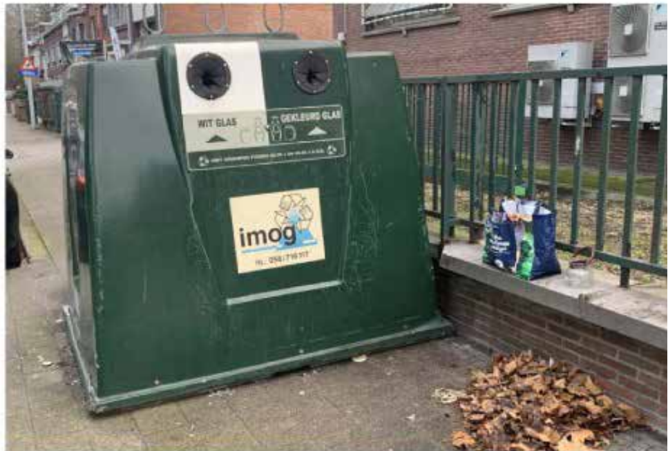
De omgeving van de glasbol is niet altijd even proper. Sommigen zetten ook gewoon glasafval ernaast, zoals hier in de Marksesteenweg.

Kortrijk heeft ook 118 mooimakers. Die gaan maandelijks op pad om in een bepaalde omgeving afval op te ruimen. Ook zij krijgen daar een vrijwilligersvergoeding voor en een opleiding. Mooimakers zijn gewone burgers, geen ordehandhavers. Ze kunnen zich niet gedragen als de