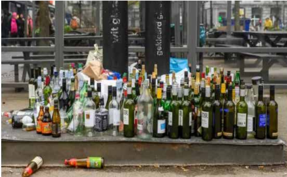
illustratiebeeld (niet in Kortrijk)