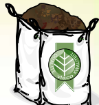
Bigbag (1m 3 )